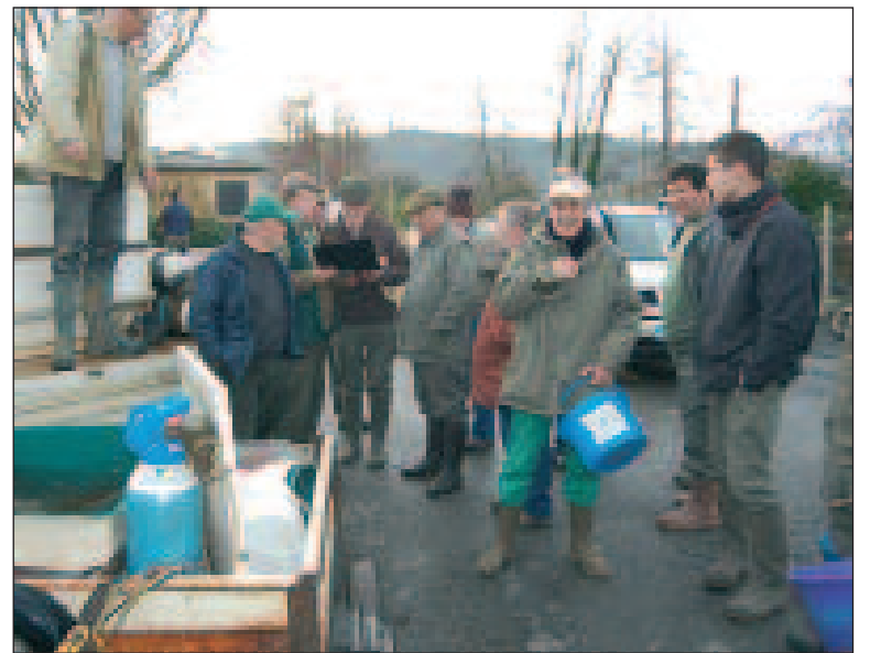
Répartition des tâches