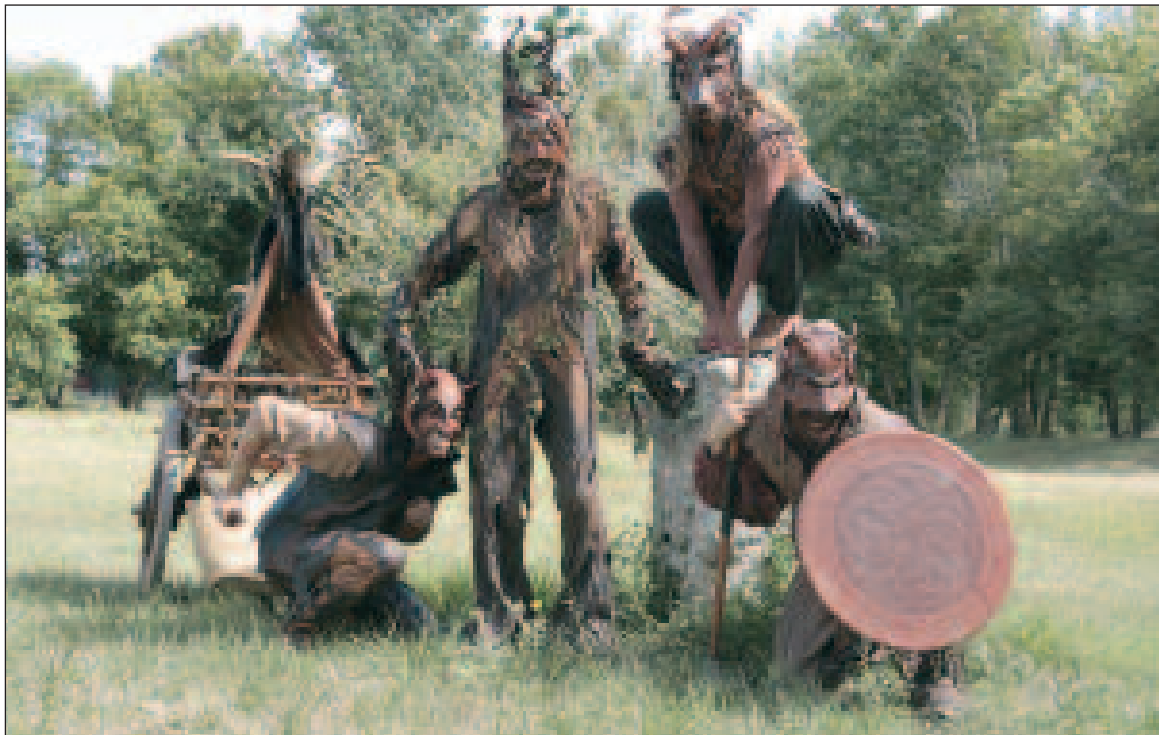
La compagnie L'Arche en Sel présentera un spectacle gratuit, "les Enfants de la Forêt"

Réjouissez-vous, bonnes gens, la belle saison est annoncée ! La preuve, c'est que dimanche 7 mars toute la journée c'est la Foire de l'arbre à Saint-Martial-de-Nabirat. Le rendez-vous des amoureux de la nature, parce qu'on est pile-poil à ce moment de l'année où, si l'on veut avoir des fleurs et des fruits en saison, il faut songer à reprendre en main toutes les créatures de Dieu soi-disant inanimées qui peuplent le jardin et nous donnent de la joie juste en les regardant.