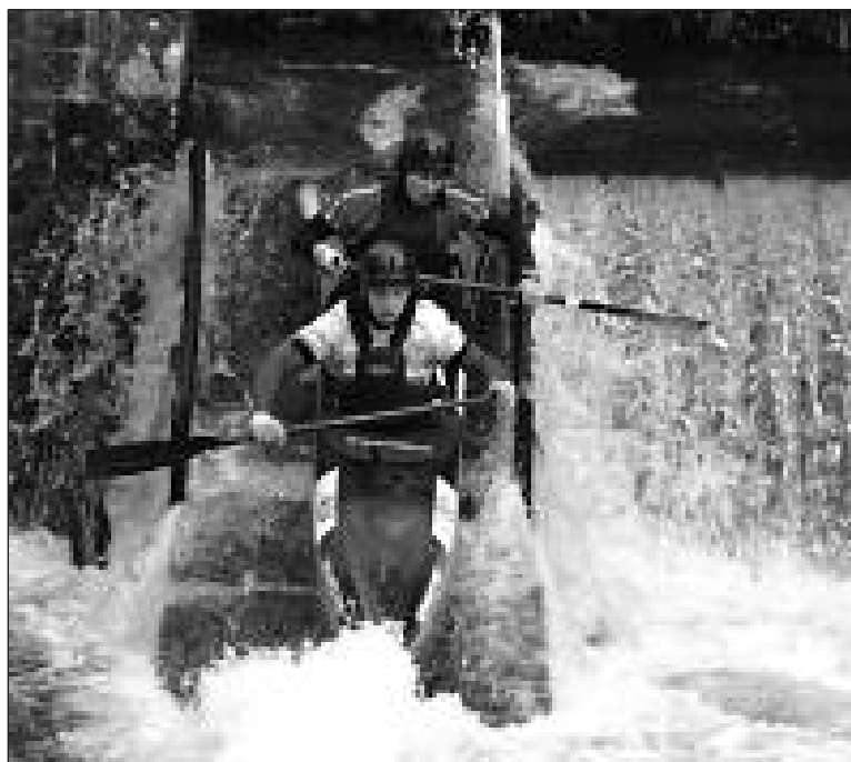
Des juniors en pleine négociation de la glissière de départ

Après deux jours d'attente, les résultats du Scorff viennent de paraître... Suspense jusqu'au bout, mais l'attente en valait le coup, tous les compétiteurs participants du club sont qualifiés pour les championnats de France !