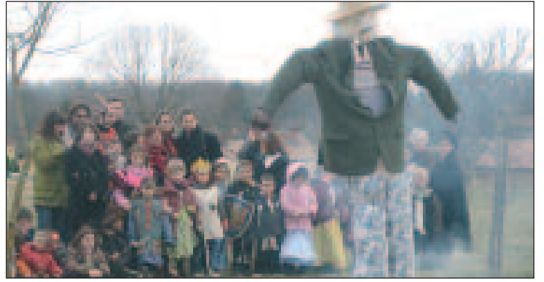
Pauvre Pétassou il va subir son sort sans mot dire !