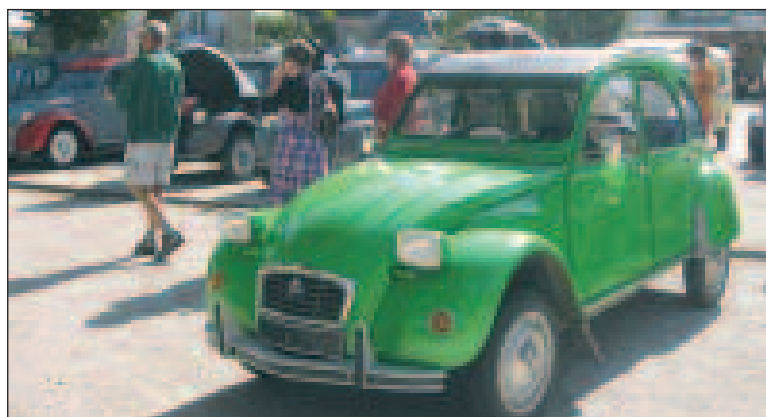
Les 2 CV, comme les hirondelles, annoncent le printemps

Le but est de se retrouver, pour le plaisir d'abord, et aussi pour échanger des informations utiles pour conserver ces voitures en bon état.