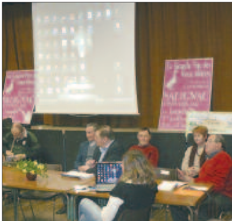
Les projets pour 2010 : les battages

Le point a aussi été fait sur le site du Case où ont lieu les fêtes, l'achat